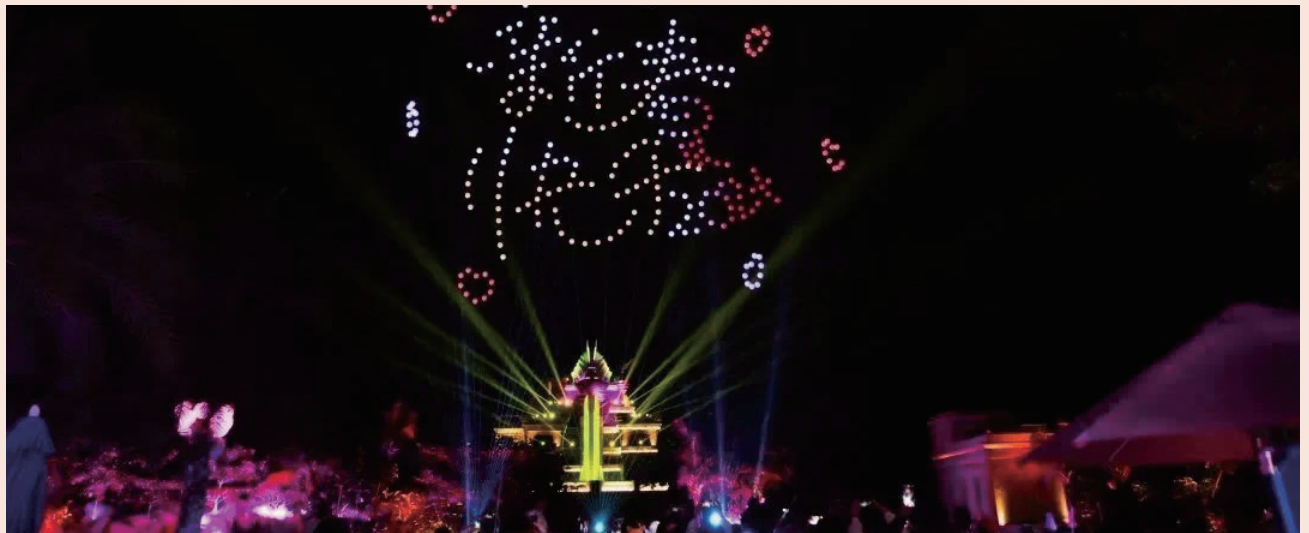
2024年春节假期三亚亚特兰蒂斯度假区七日累计接待游客28万人次，再创新高