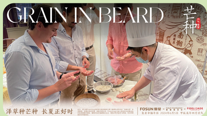
泽草种芒种 长夏正好时 FOSUN 复星 × FIDELIDADE 复星幸福年历 2024年6月5日 甲辰龙年四月廿九

Protecting6.0 三强团队来华开启“青创无界”系列路演。Protecting6.0 由上海复星公益基金会和复星葡萄牙保险、葡萄牙医疗集团联合主办，聚焦 AI 时代医疗与科技、ESG 等领域青年科创项目。