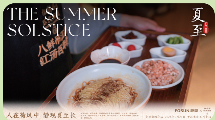
人在荷风中 静观夏至长 FOSUN 复星 × 松鹤楼 复星幸福年历 2024年6月21日 甲辰龙年五月十六

新麦初收，时令知味。松鹤楼面馆带来时令鲜美，三虾面、风扇凉面、绿豆汤，邀你来一尝江南意趣。联名庆余年2，现实版松鹤楼「南庆面馆」限定上线。