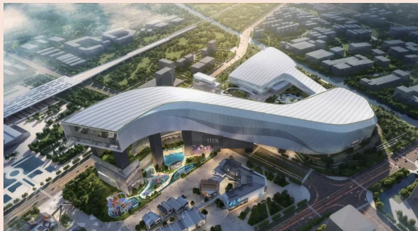
二期项目有望成为最大规模体量的一站式冰雪主题旅游度假目的地