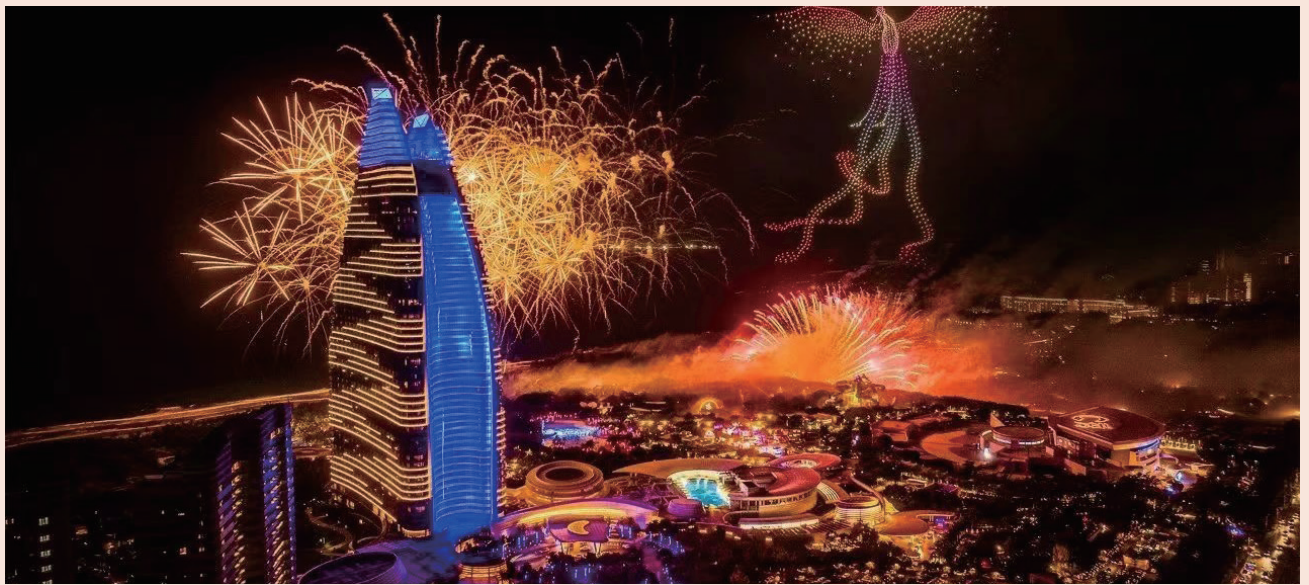
2024年5月1日，三亚亚特兰蒂斯迎来六周年庆典，六年来持续为海南旅游度假发展添动力

有市场人士估计，曾打造三亚亚特兰蒂斯项目的复星旅文也有可能以品牌输出、产品输出、运营输出等轻资产运营的形式，参与到这一项目的规划与打造，将旗下Club Med地中海俱乐部等国际级的度假产品引