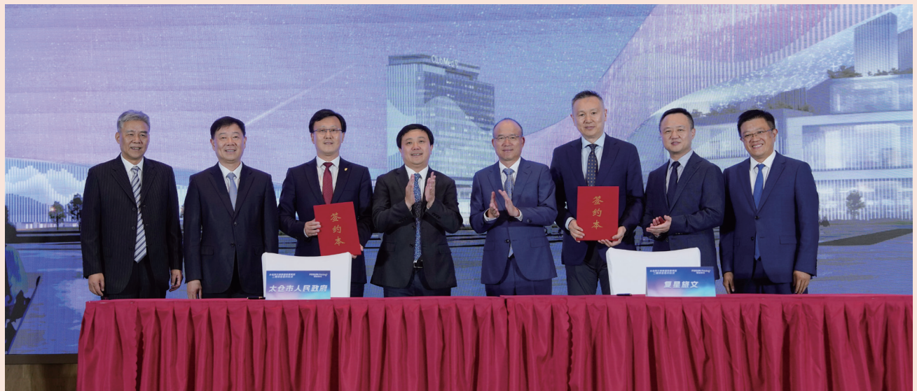
太仓阿尔卑斯国际度假区二期项目正式签约