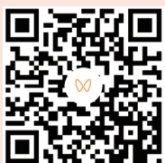
郭广昌：说说全球化的这个“宝藏国家”