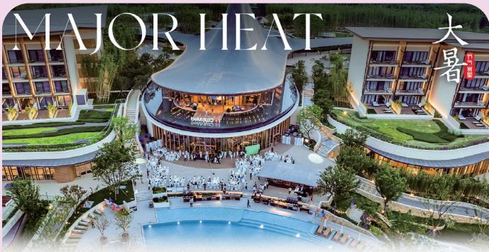
大暑风不渡 热烈自清凉 7月11日, Club Med Joyview 地中海邻境·黑龙滩度假村正式启幕。黑龙滩度假村地处四川省眉山市, 依托依山傍水的自然风光, 将巴蜀文化与法式度假巧妙融合, 开启「法适」假期。 FOSUN 复星 x Club Med 复星幸福年历 2024年7月22日 甲辰年六月初七

7月11日, Club Med Joyview 地中海邻境·黑龙滩度假村正式启幕。黑龙滩度假村地处四川省眉山市, 依托依山傍水的自然风光, 将巴蜀文化与法式度假巧妙融合, 开启「法适」假期。