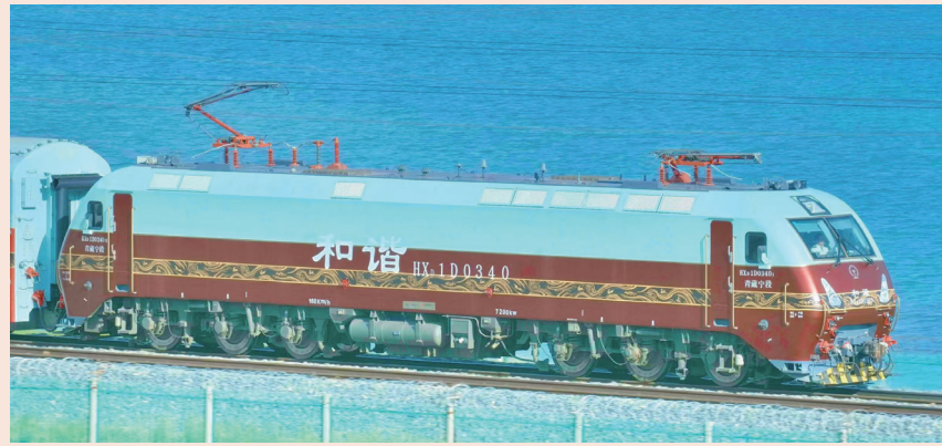
丝路梦享号开过青海湖

全车共有 15 节车厢, 除全独立卫浴卧房车厢外, 还配有客厅沙龙车、中西式餐车以及可观景、品茗、提供 KTV 欢唱等娱乐活动的多功能车厢。5 位度假大使和专业的列车管家团队将为游客提供 24 小时服务,