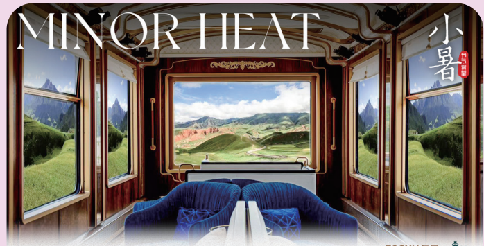
小暑有余闲 踏歌入清风 7月6日, 星享铁旅·丝路梦享号举行发车仪式。以世界级高品质专列标准打造的“丝路梦享”号, 火车即目的地, 由西宁来往敦煌, 偶遇七彩丹霞、莫高窟、察尔汗盐湖, 移步一景, 重走千年丝绸之路。 FOSUN 复星 x 铁旅 复星幸福年历 2024年7月6日 甲辰年六月初一

7月6日, 星享铁旅·丝路梦享号举行发车仪式。以世界级高品质专列标准打造的“丝路梦享”号, 火车即目的地, 由西宁来往敦煌, 偶遇七彩丹霞、莫高窟、察尔汗盐湖, 移步一景, 重走千年丝绸之路。