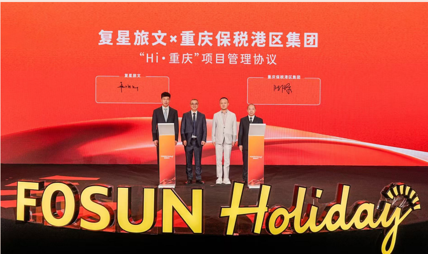
复星旅文与重庆保税港就Hi·重庆项目签约