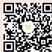
郭广昌：八年进博全勤，复星全球创新成果持续落地（扫码看视频）

的帕金森联合治疗选择，口服COMT抑制剂欧捷能（奥吡卡朋）是目前全球唯一获批的每日一次用药的COMT抑制剂，显著提升帕金森病患者用药便捷性与依从性。目