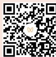
陈启宇：复星整合全球资源助力本土创新（扫码看视频）