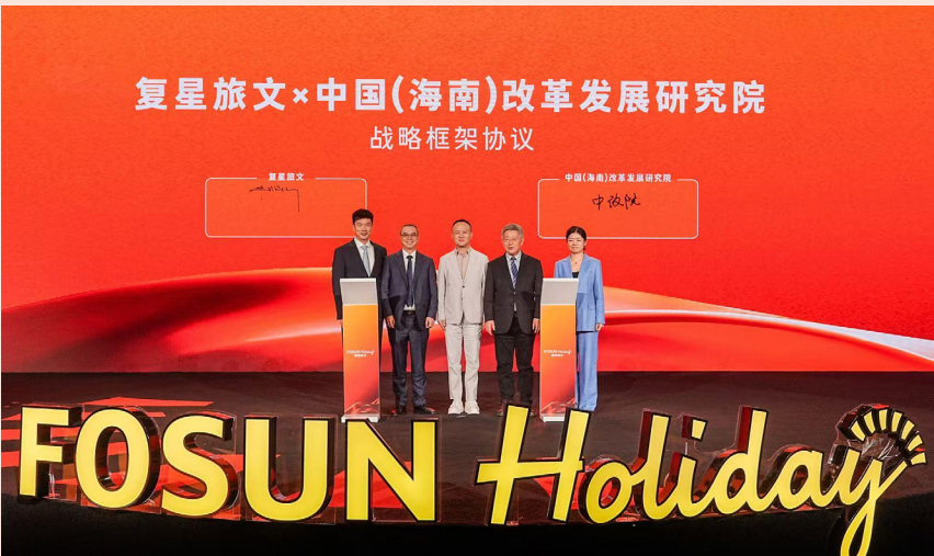
复星旅文与中国（海南）改革发展研究院正式签署战略框架协议